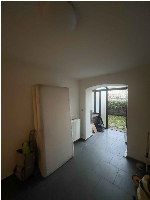
10. Studio côté rue RDC