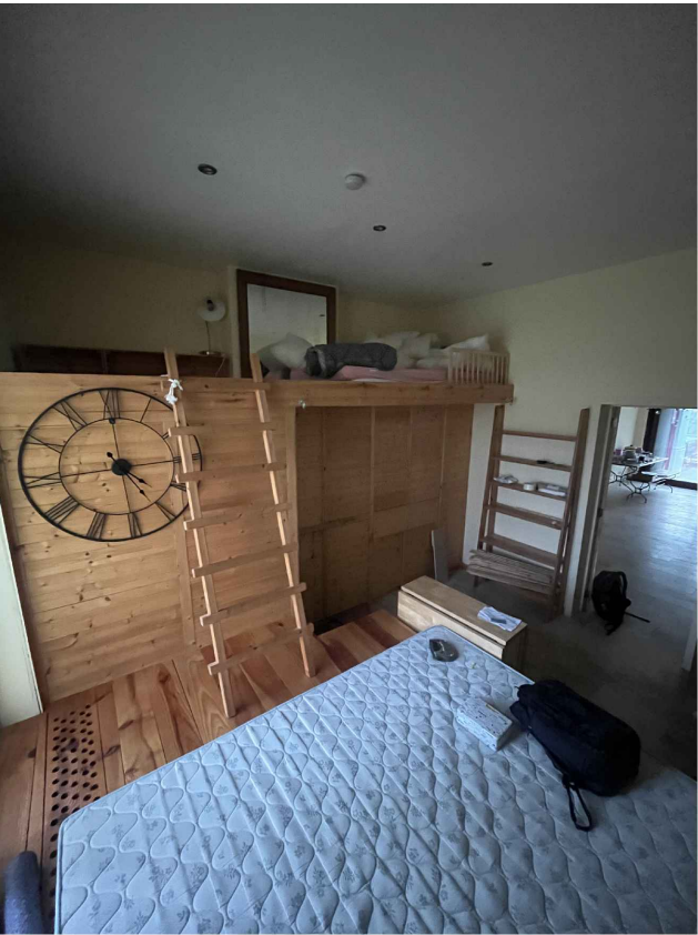
12. Logement R+1