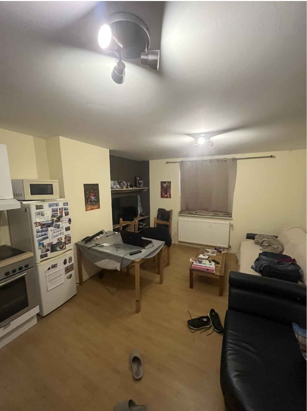
15. Logement R+3