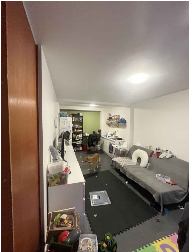
9. Studio côté jardin RDC