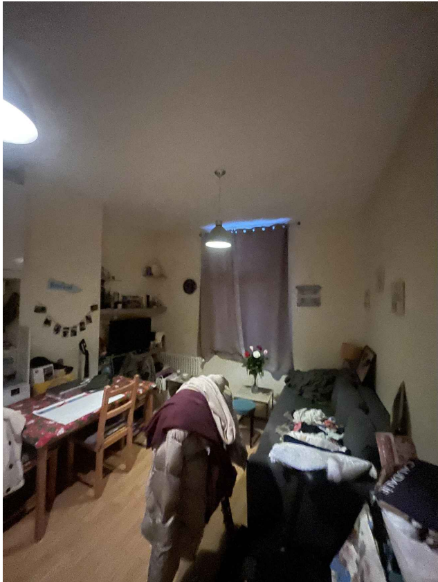
13. Logement R+2