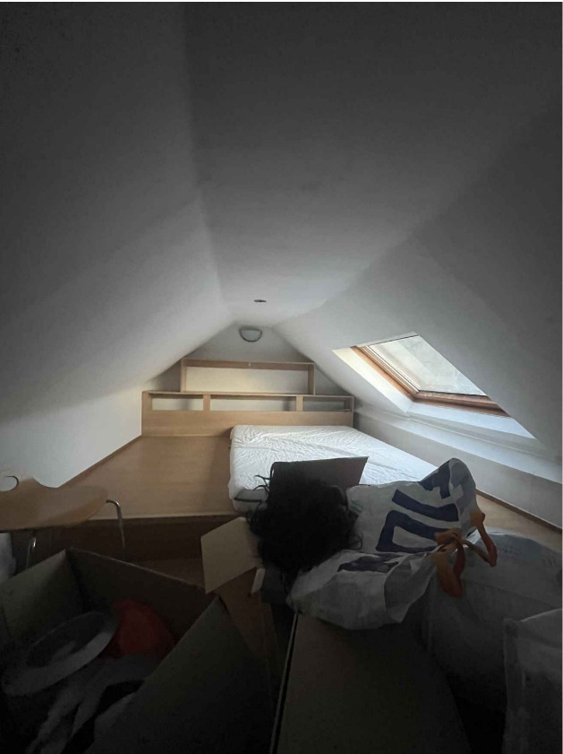
16. Logement R+3