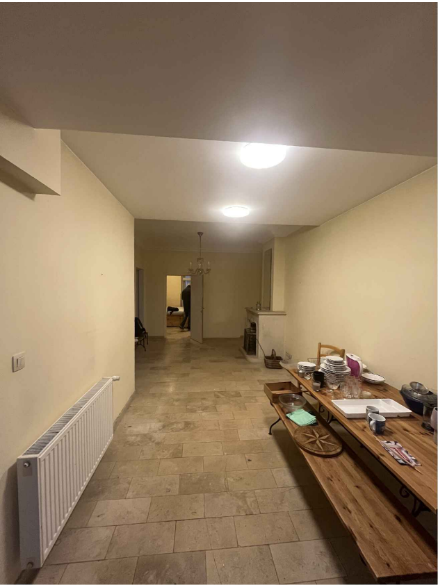
11. Logement R+1